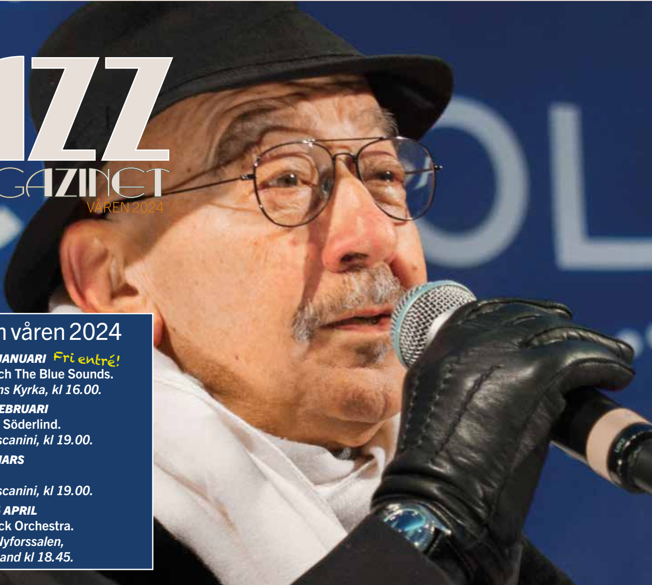
Hayati Kafé på Sergels torg i samband med invigningen av Stockholmsjul 2015.